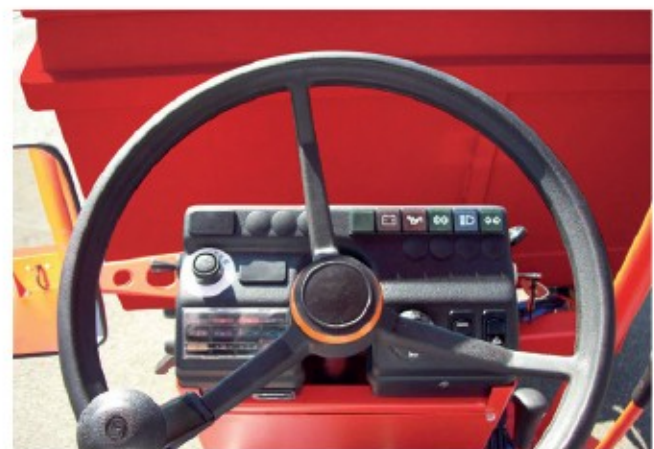
New dashboard Nuovo cruscotto Nouveau tableau de bord Nuevo tablero de instrumentos